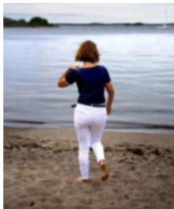
Vissa badplatser har fått bli skådeplats för litterära likfynd.

så. Hennes ansikte pryder kartor som lotsar mordsugna turister till viktiga platser i böckerna om polisen Thomas och bankjuristen Nora.