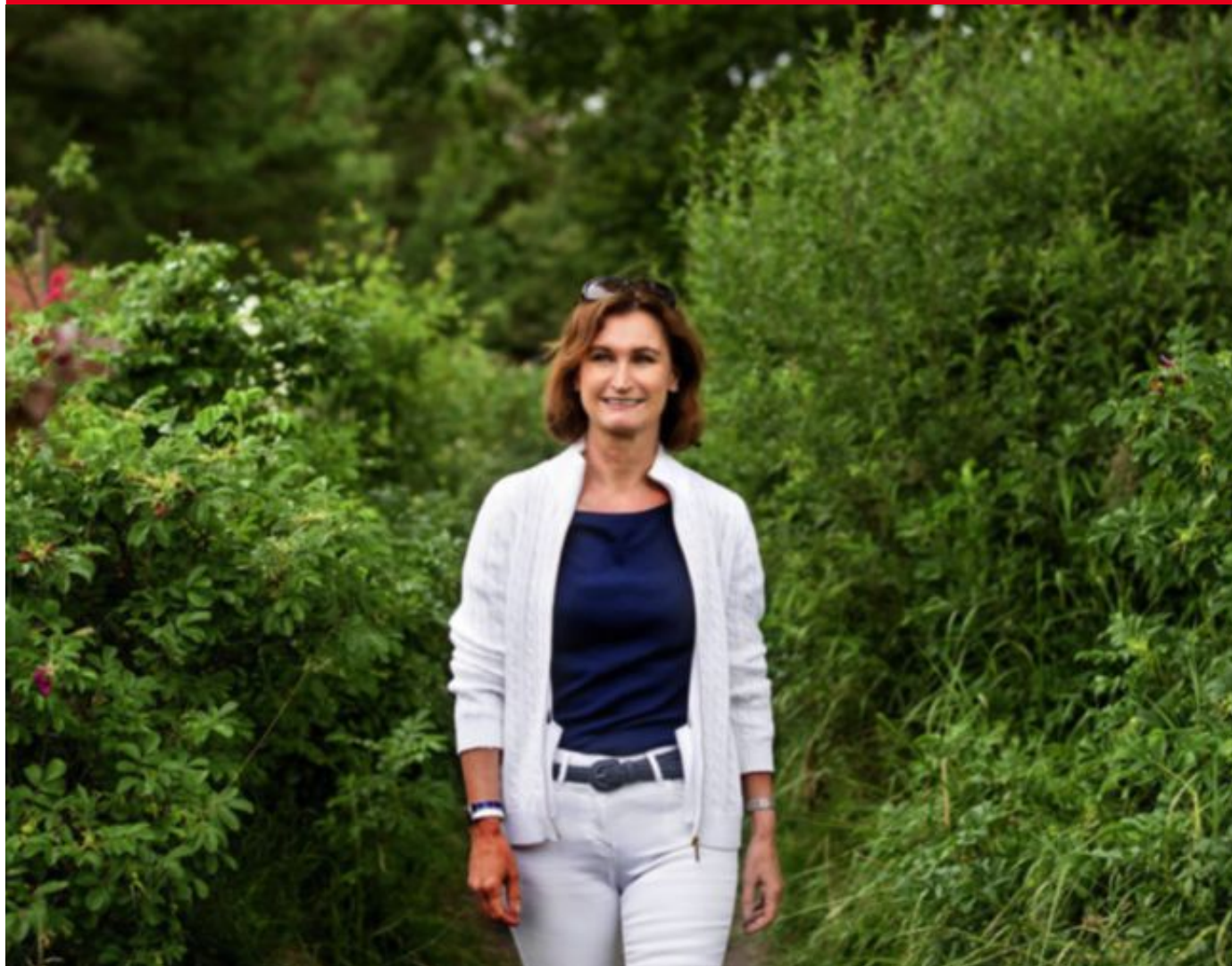
Författaren Viveca Sten placerar sina mördare mitt i idyllen på Sandhamn.