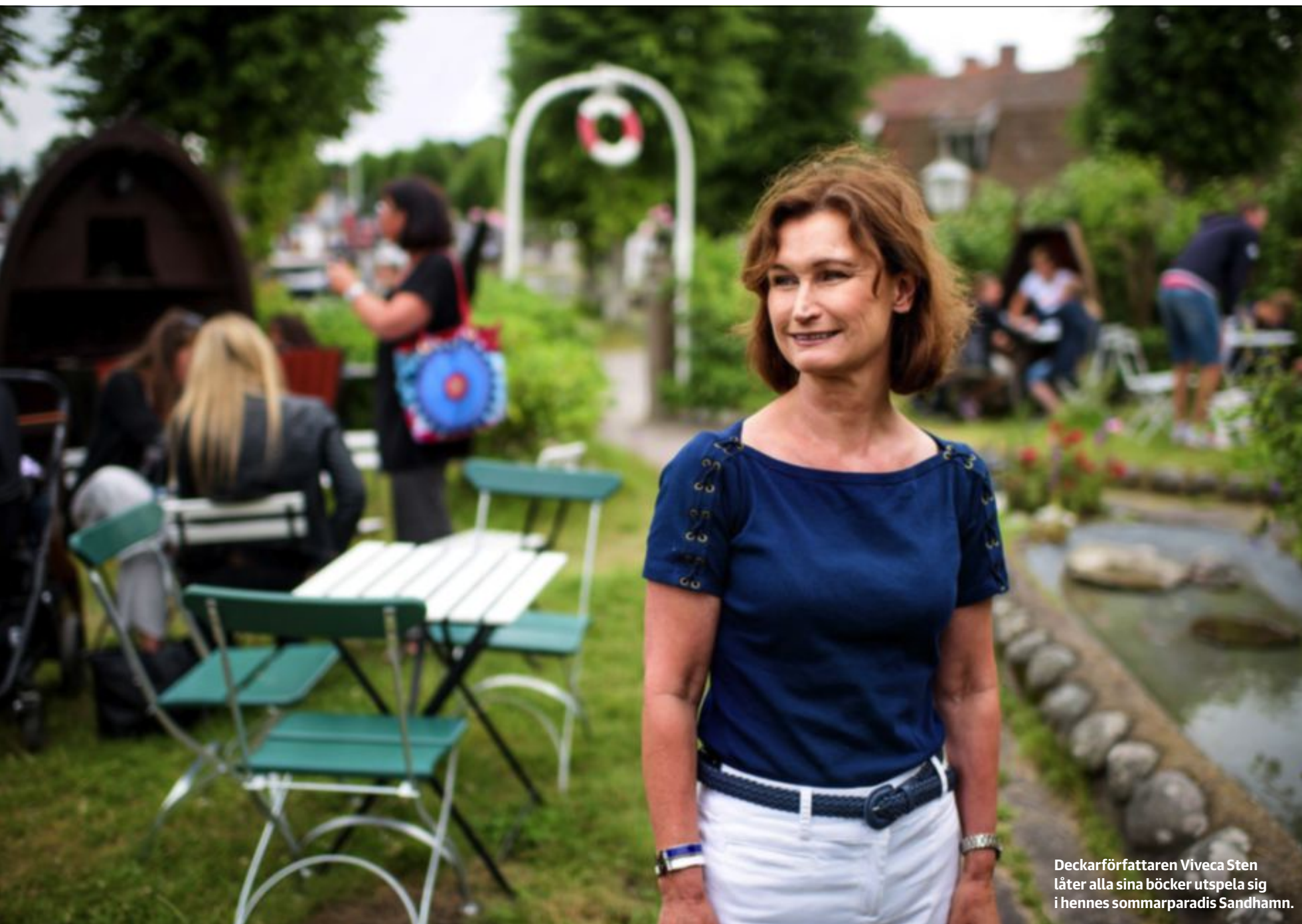
Deckarförfattaren Viveca Sten låter alla sina böcker utspela sig i hennes sommarparadis Sandhamn.

pratar en stund. Det märks att Viveca Sten har varit både mycket och länge på ön under sina 56 år i livet.